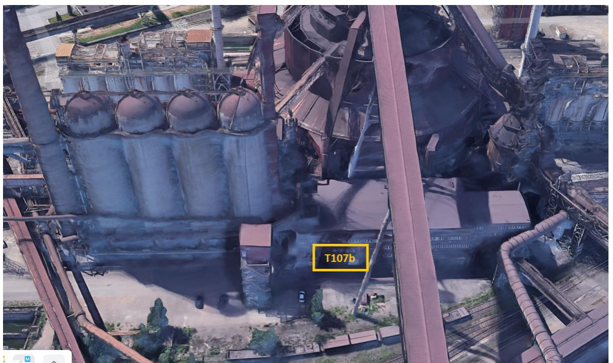
Rys. Rozdzielni 0,4kV T107b