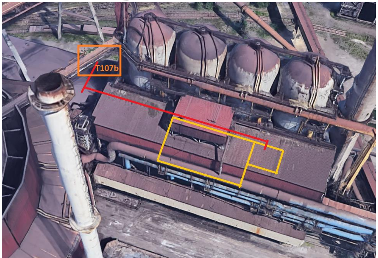
Rys. Przebieg trasy kabli nN relacji T107b a nowa rozdzielni MCC pompowni