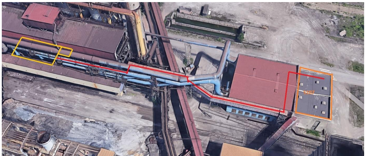
Rys. Przebieg trasy kabli SN relacji S107 a nowa pompownia